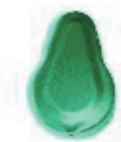
外付ひょうたん型サンバナ