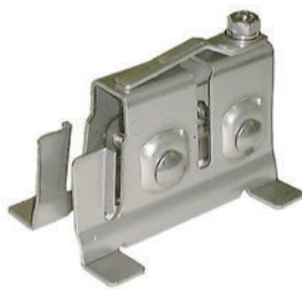
アングル用雪止 アングル50mmまで